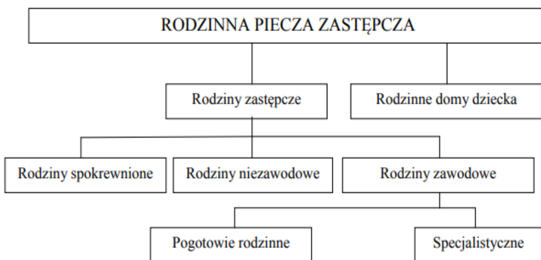
Schemat 1. Podział rodzinnej formy pieczy zastępczej.

Podział rodzinnej formy pieczy zastępczej ilustruje poniższy schemat: